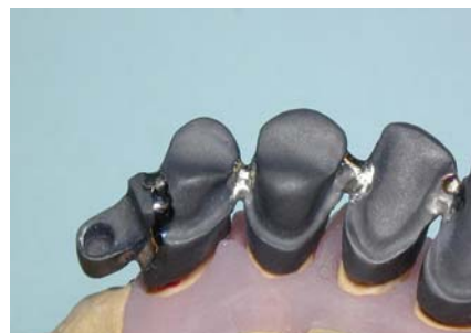
SOUDURE LASER SUR CHAPE CERAMIQUE EN TITANE PUR - réalisé par le Laboratoire LOUIS (54)

La soudure au laser (voir article page 2) ou au plasma qui équipent nos laboratoires permet de réaliser des adjonctions sans apport de matériaux annexes.