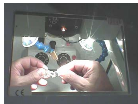
Soudure LASER - Laboratoire BERNARD (95)

L'avantage principal du LASER est de supprimer les brasures souvent responsables de corrosion galvanique. De plus la soudure LASER s'effectue sous atmosphère neutre (argon) : cela permet de souder le TITANE PUR (et les autres alliages) sans aucun problème. La soudure LASER est la soudure biocompatible par excellence. Le LASER est donc vraiment la soudure du 3 ème millénaire. Les laboratoires SYNERGIS vous la proposent, n'hésitez pas à les consulter!